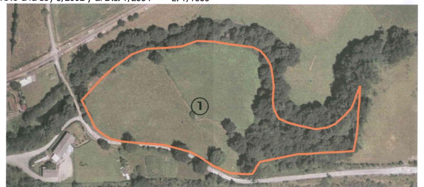
vista aérea E: 1/2000