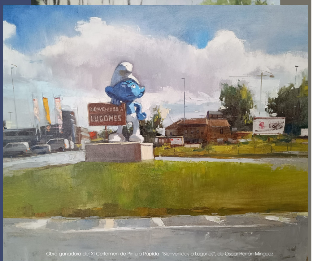
Obra ganadora del XI Certamen de Pintura Rápida: "Bienvenidos a Lugones", de Óscar Herrán Minguez

Sábado 6 de junio de 2026 Inscripciones hasta las 14:00 horas del 4 de junio Bases disponibles en la web municipal: www.ayto-siero.es Información adicional en el Centro Polivalente Integrado de Lugones