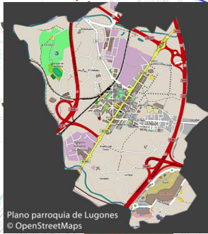
Plano parroquia de Lugones