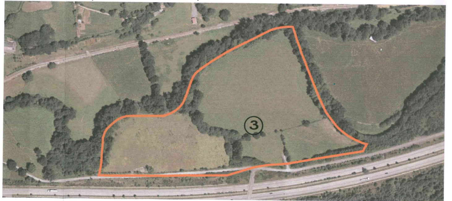
vista aérea E: 1/4000

delimitante nieve camino hevia mayo 2008 (A.D) E: 1/2000 1/4000