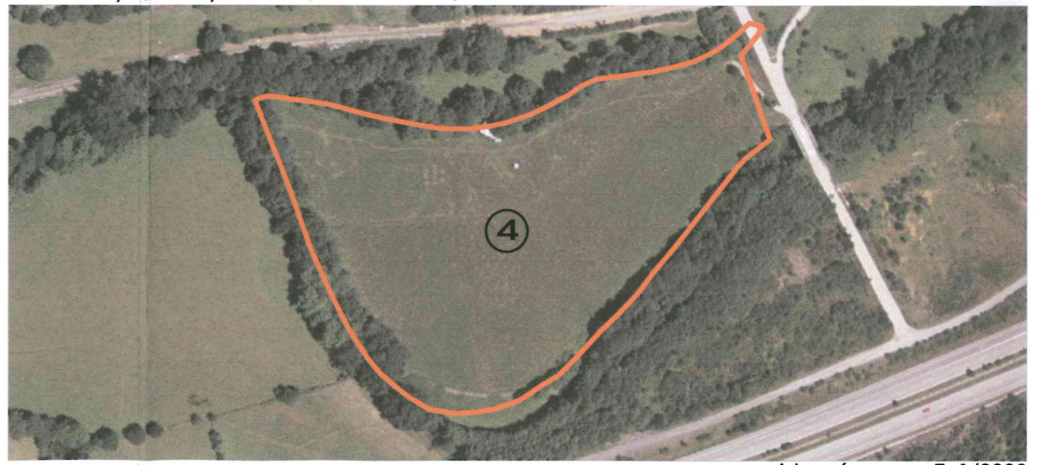
vista aérea E: 1/3000

delimitante nieves camino hevia mayo 2008 (A.D) E: 1/1500 1/3000