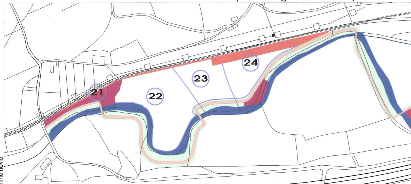
superficie según expropiación para paseo fluvial E: 1/4000