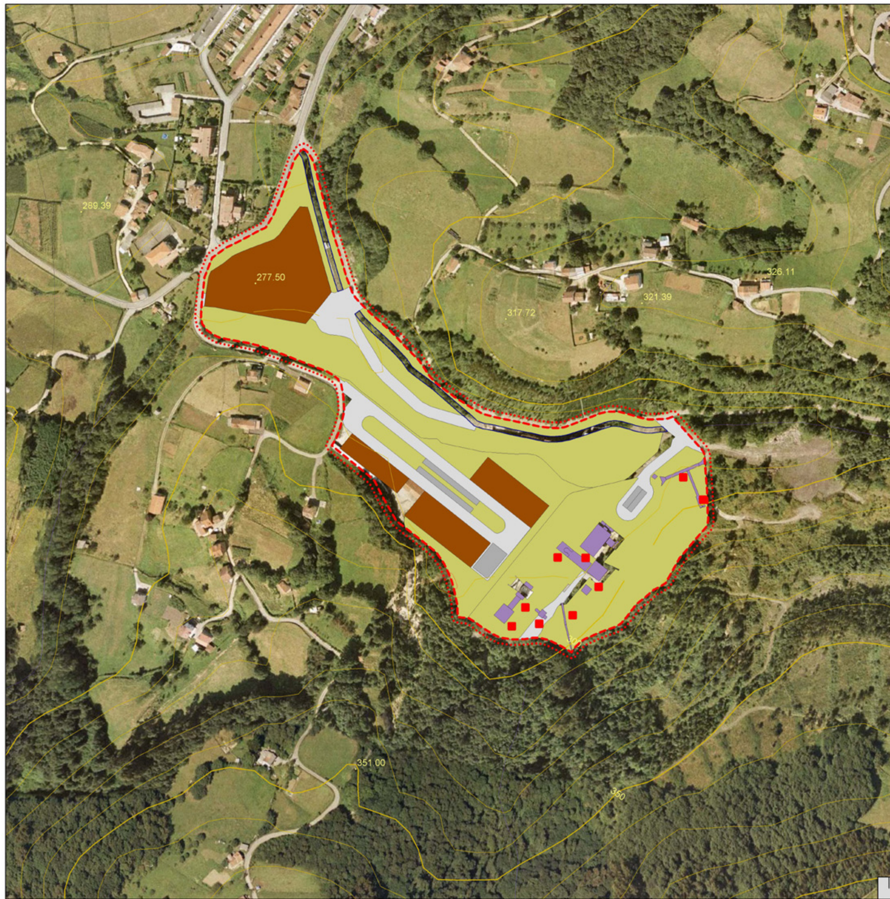
[2] LEYENDA SEGÚN COMPOSICIÓN DE PLANO