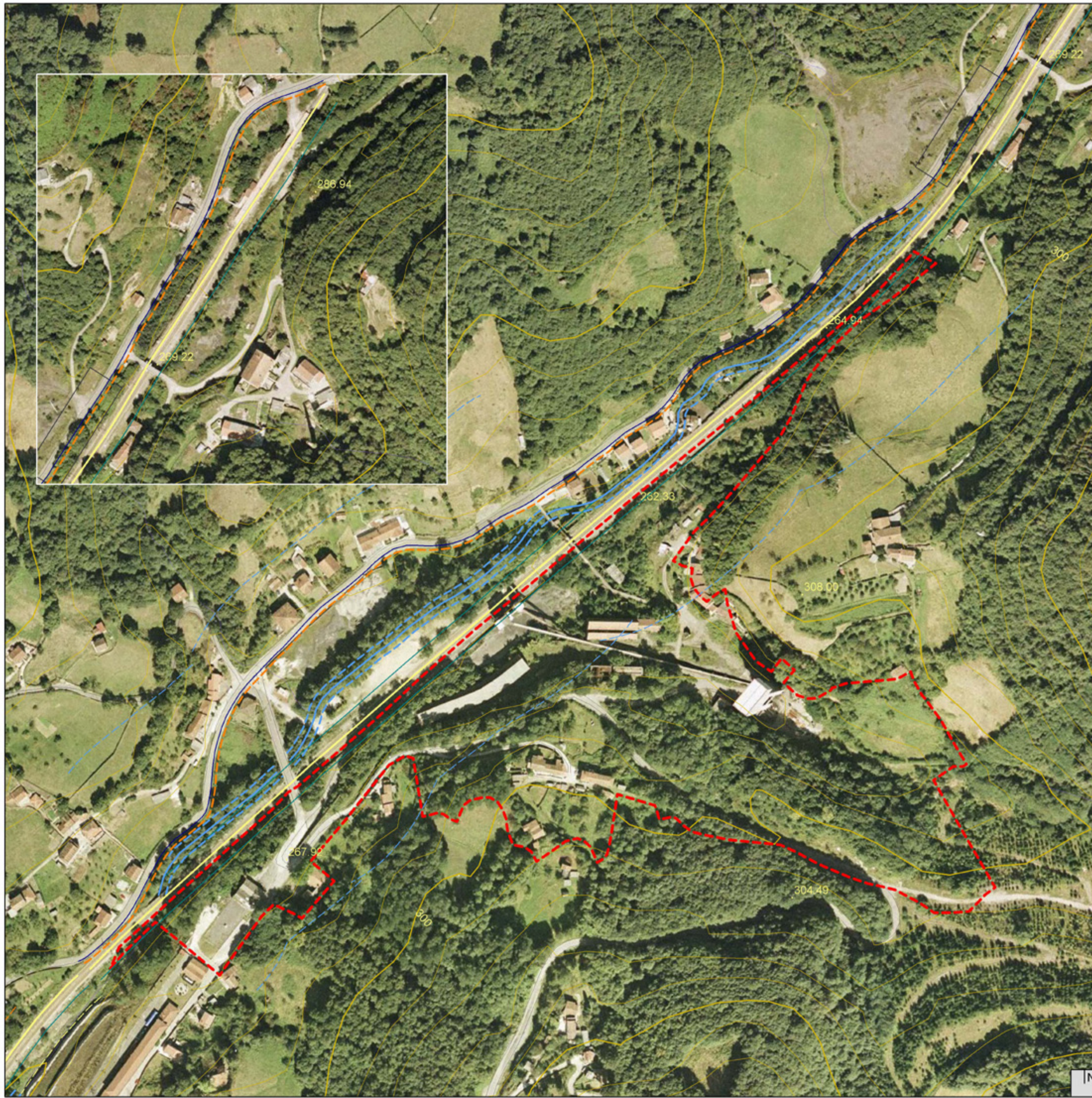
[1] LEYENDA SEGÚN COMPOSICIÓN DE PLANO