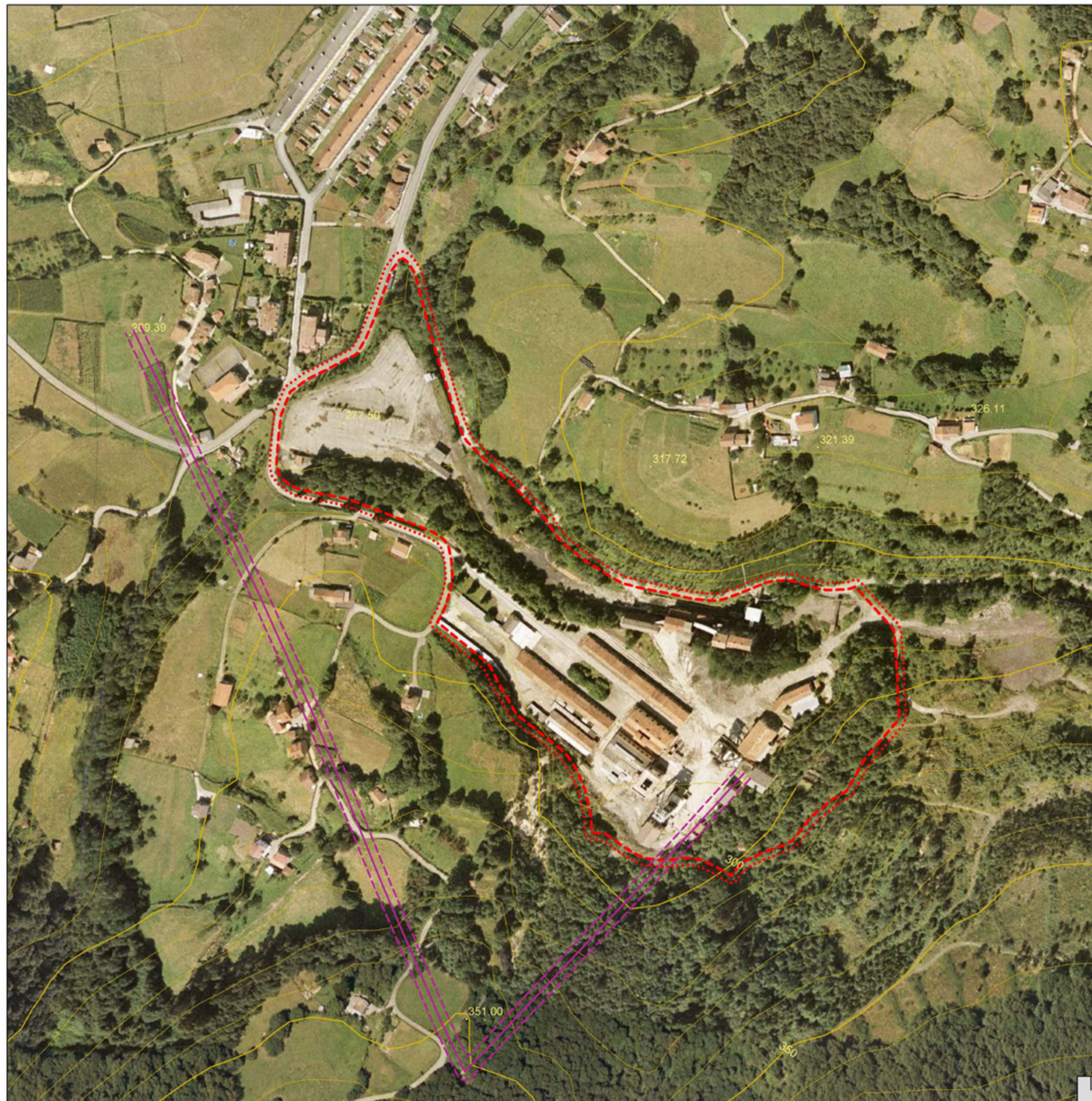
[1] LEYENDA SEGÚN COMPOSICIÓN DE PLANO