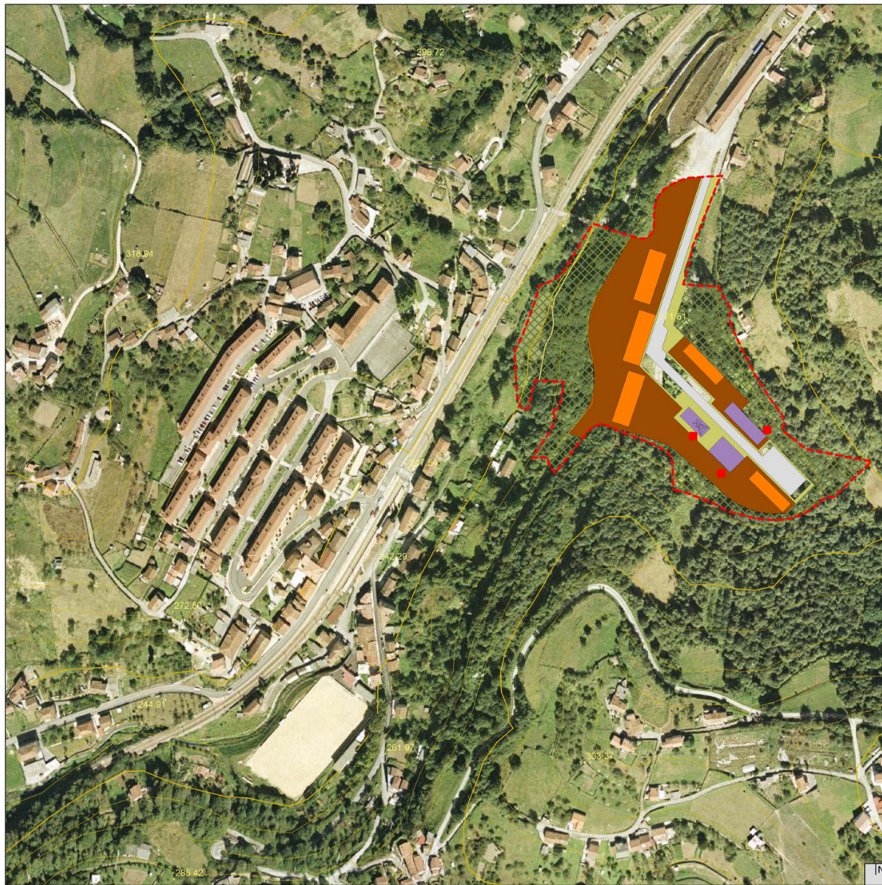
[2] LEYENDA SEGÚN COMPOSICIÓN DE PLANO