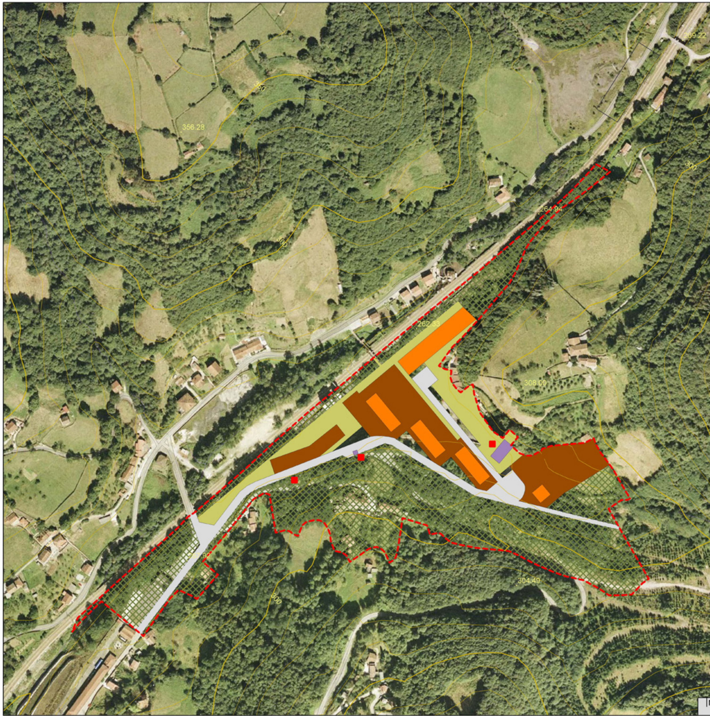
[2] LEYENDA SEGÚN COMPOSICIÓN DE PLANO