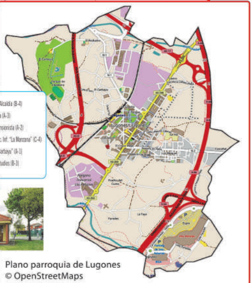
Plano parroquia de Lugones